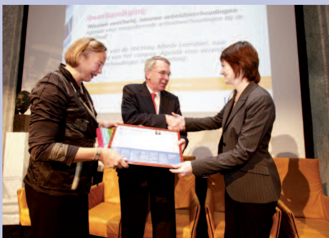
CAOP © Herbert Wiggerman

De scriptieprijs belooft studenten uit het hoger en wetenschappelijk onderwijs voor het onderzoeken van vraagstukken op het gebied van arbeidsverhoudingen bij de overheid.