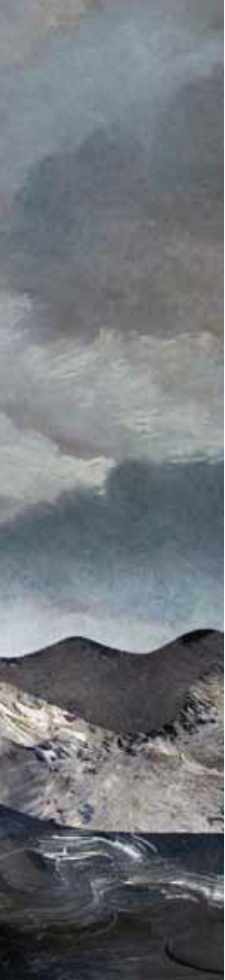
Illustratie: Matthijs Sluiter

State of the Union is de eindverantwoordelijke voor de tekst niet dezelfde als de spreker: alleen de premier kan politiek afgerekend worden op de Troonrede, niet de vorst dus.